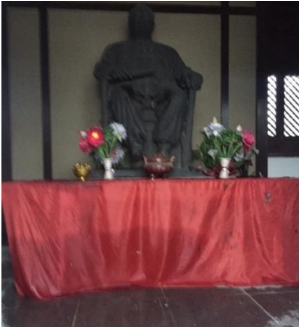
La statua di Fu Zhong Wen nel Mausoleo